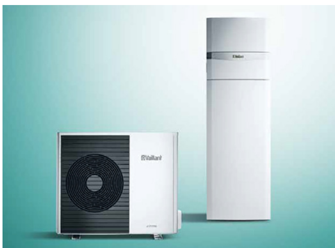
Tepelné čerpadlo aroTHERM Split vzduch-voda, hydraulický modul uniTOWER