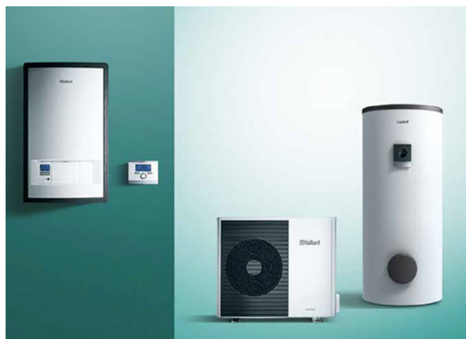
Závesný hydraulický modul, systémový regulátor multiMATIC VRC 700, tepelné čerpadlo aroTHERM Split vzduch-voda so zásobníkom teplej vody uniSTOR